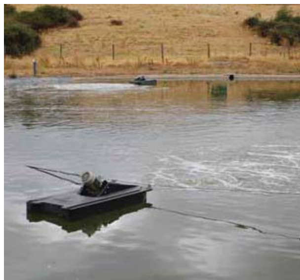
Аэратор 275 установленный на понтон Uni-float. Благодаря подводной аэрации и перемешиванию не создаёт волн, брызг и шума.