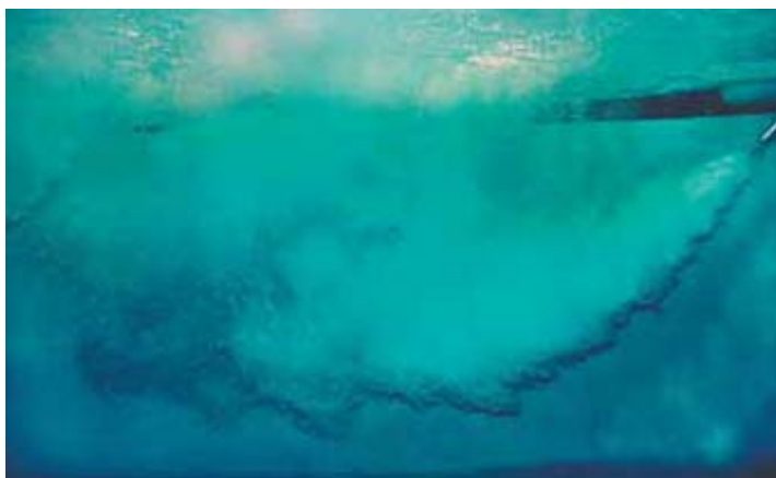
Вид под водой во время работы аэратора 275